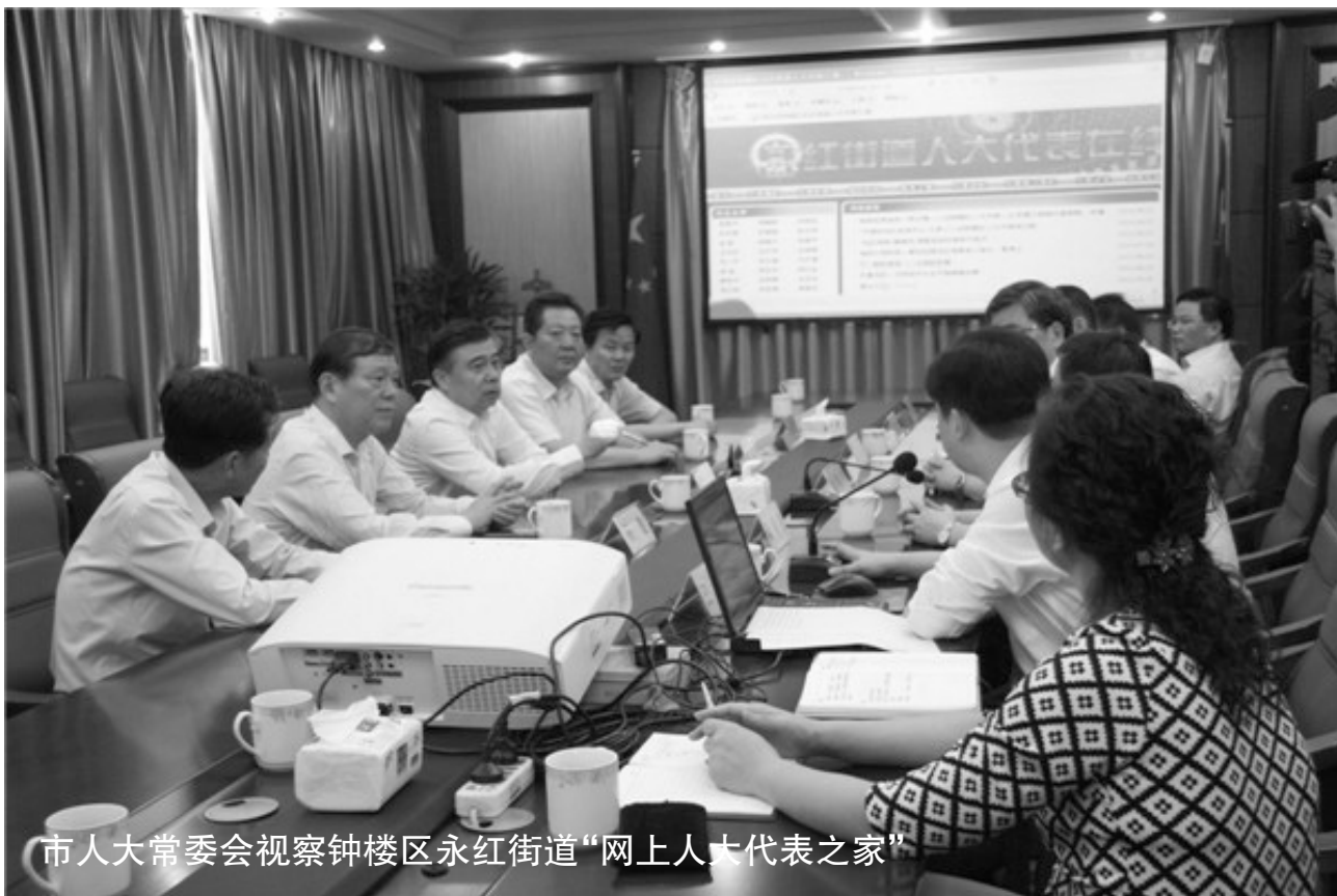
市人大常委会视察钟楼区永红街道“网上人大代表之家”