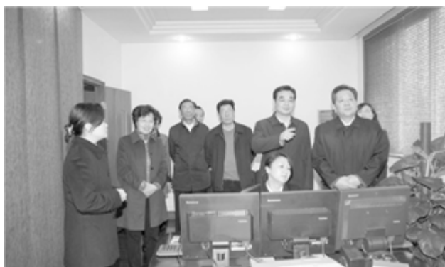
把脉问诊住房公积金管理工作

的差距。已参缴单位也存在不按规定基数足额缴纳和拖欠应缴款的现象，损害了职工的合法利益。二是住房公积金制度宣传还不够全面。对住房公积金缴纳基数计算、缴纳比例、提取和贷款使用条件及程序等宣传不够，社会对住房公积金的认识程度不如养老保险金和医疗保险金，企业建缴主动性不高，职工的维权意识不强。三是住房公积金管理力量还不足。住房公积金管理工作人员少，业务量大，难以满足现有工作和业务发展。目前大量使用派遣制员工的做法，不利于规范行业行为、提高服务质量。